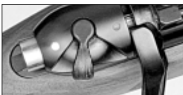
2) Mittelstellung, gesichert – Kammersperre aufgehoben