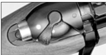
1) Gesichert, Kammer gesperrt